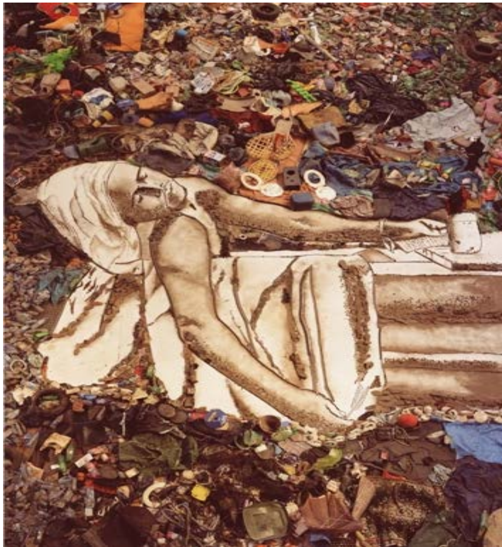
Marat (Sebastião) Pictures of Garbage (2008)