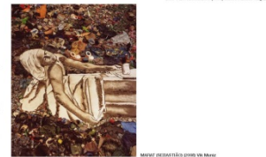
NARCISO (2007) Vik Muniz