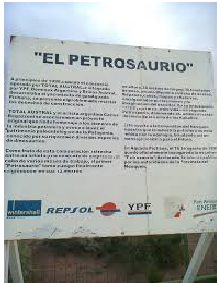
Los Petrosaurios (1997)