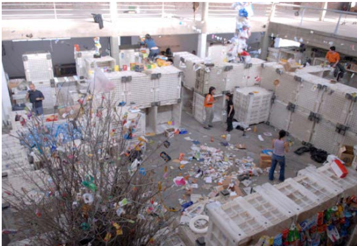
La escultura del presente (2007), realizada en el Centro Uno, General Roca, Provincia de Río Negro