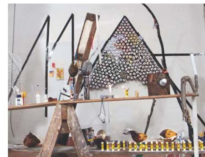
La crisis es estética (2009) de Diego Barrios

En este artista la reutilización es la operación central de la obra. Los espacios son amplios y la obra es efímera. Son instalaciones habitables donde el desecho se utiliza mediante el proceso de reutilización. La temática es la exposición de envases y el tipo de residuo son los secos. Lo que expone en términos de operaciones retóricas es la metaforización del consumismo en épocas capitalistas. El artista utiliza lo consumido lo dado en términos de Nicolás Bourriaud para exponer. Estos productos exhibidos están el lugar de l consumo.