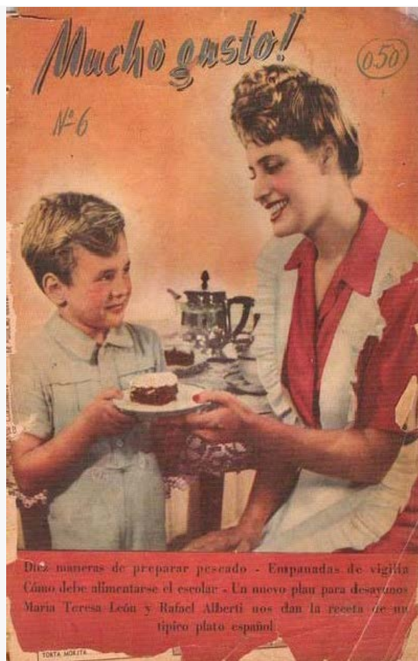
Figura 2 Ejemplar Nº 6 Año 2 – Abril 1947

2.1.2. Por lo general, las secuencias lingüísticas que aparecen en las tapas lo hacen a la manera de aserciones.