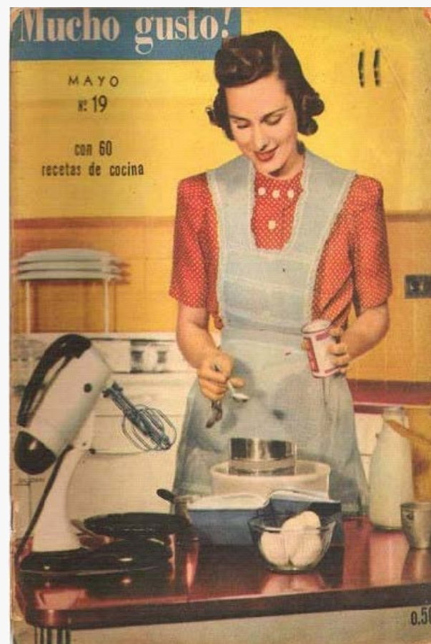
Figura 5 Ejemplar Nº 19 Año 3 – Mayo 1948