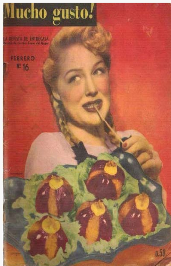
Figura 3 Ejemplar Nº 16 Año 3 – Febrero 1948