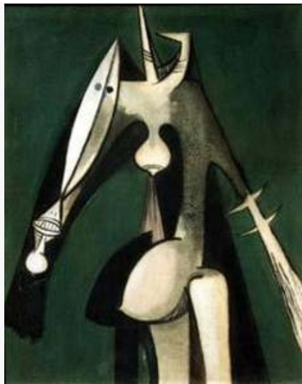
Figura 4 Wifredo Lam. Flor Luna, 1950