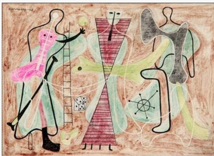
Figura 5 Mario Carreño. Escena caribeña, 1948