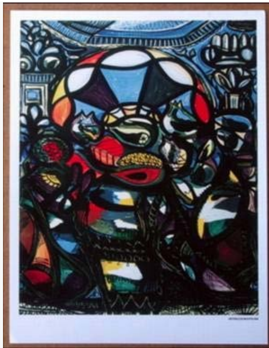
Figuras 2 Amelia Peláez. Naturaleza Muerta, 1941