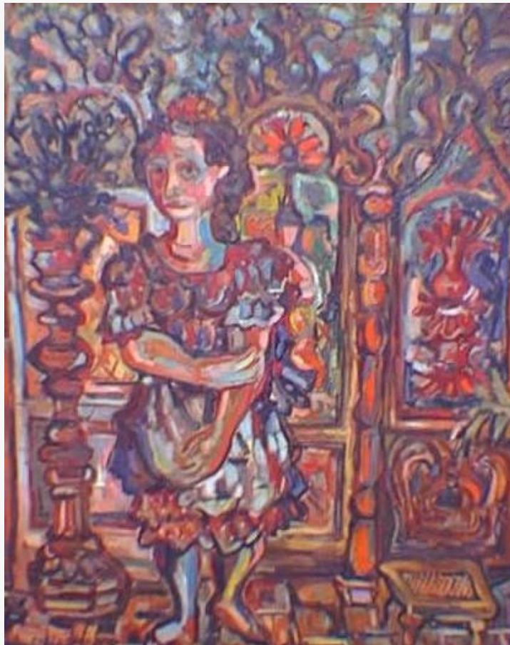
Figura 3 René Portocarrero. Interior del cerro, 1943