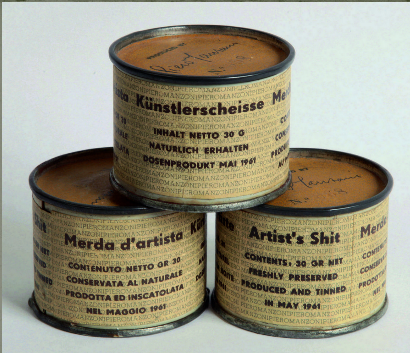
Piero Manzoni, Merda d'artista , 1961