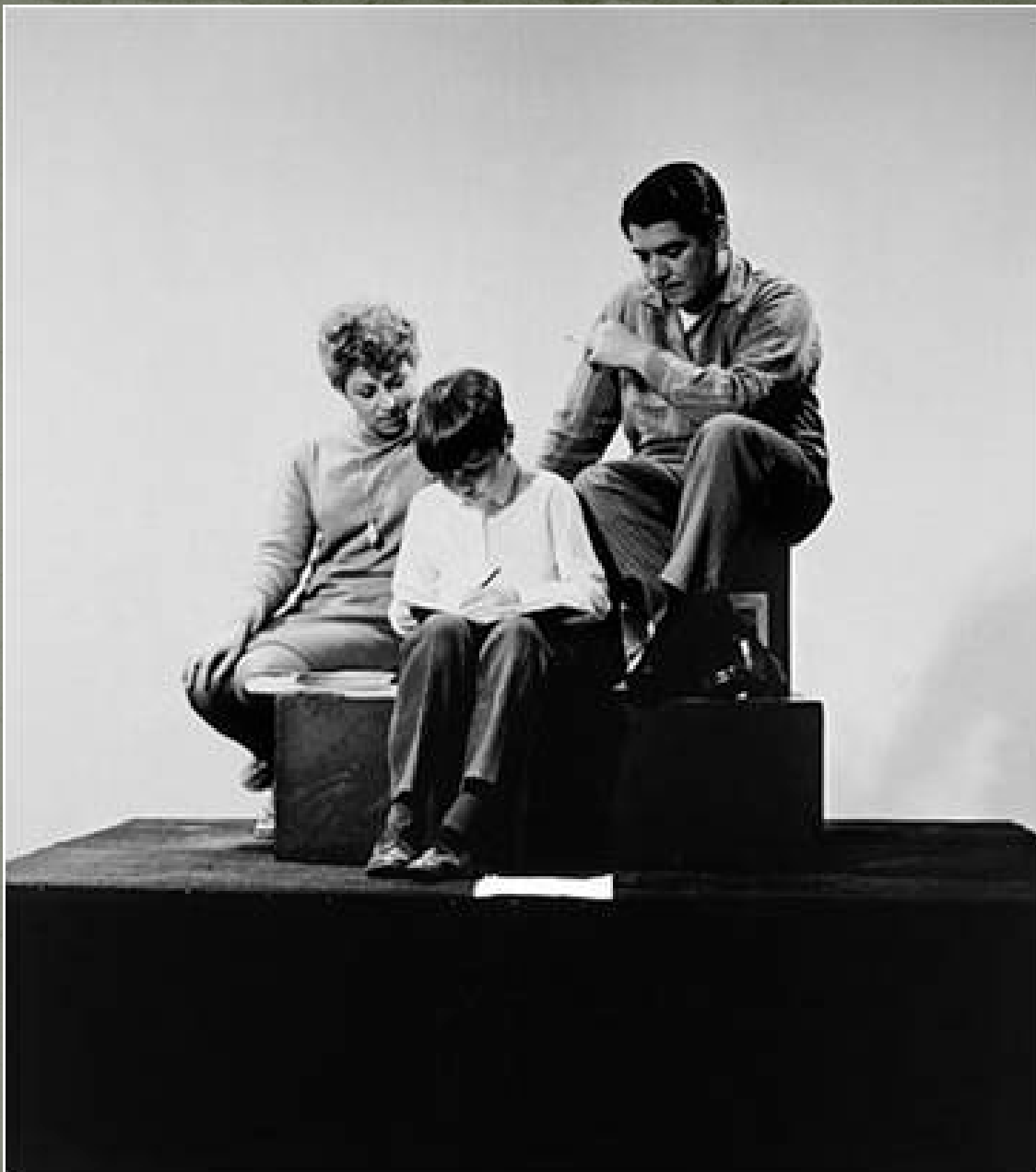
Oscar Bony, La Familia Obrera , 1968.