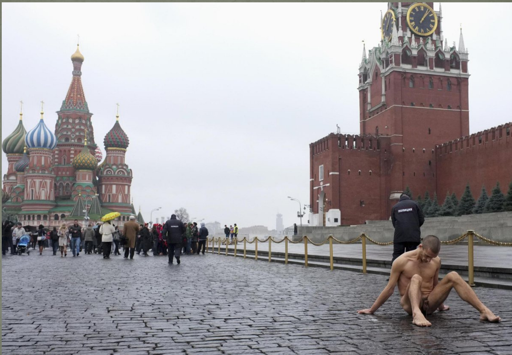
Pyot Pavlensky, Moscú, Plaza Roja, 10 de noviembre 2013