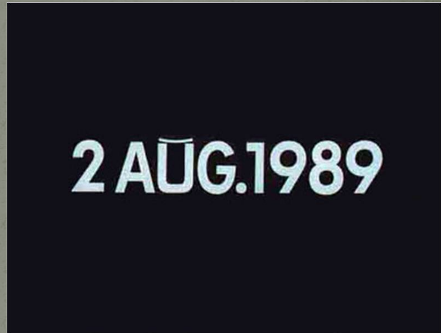
On Kawara, Today Series Date Painting