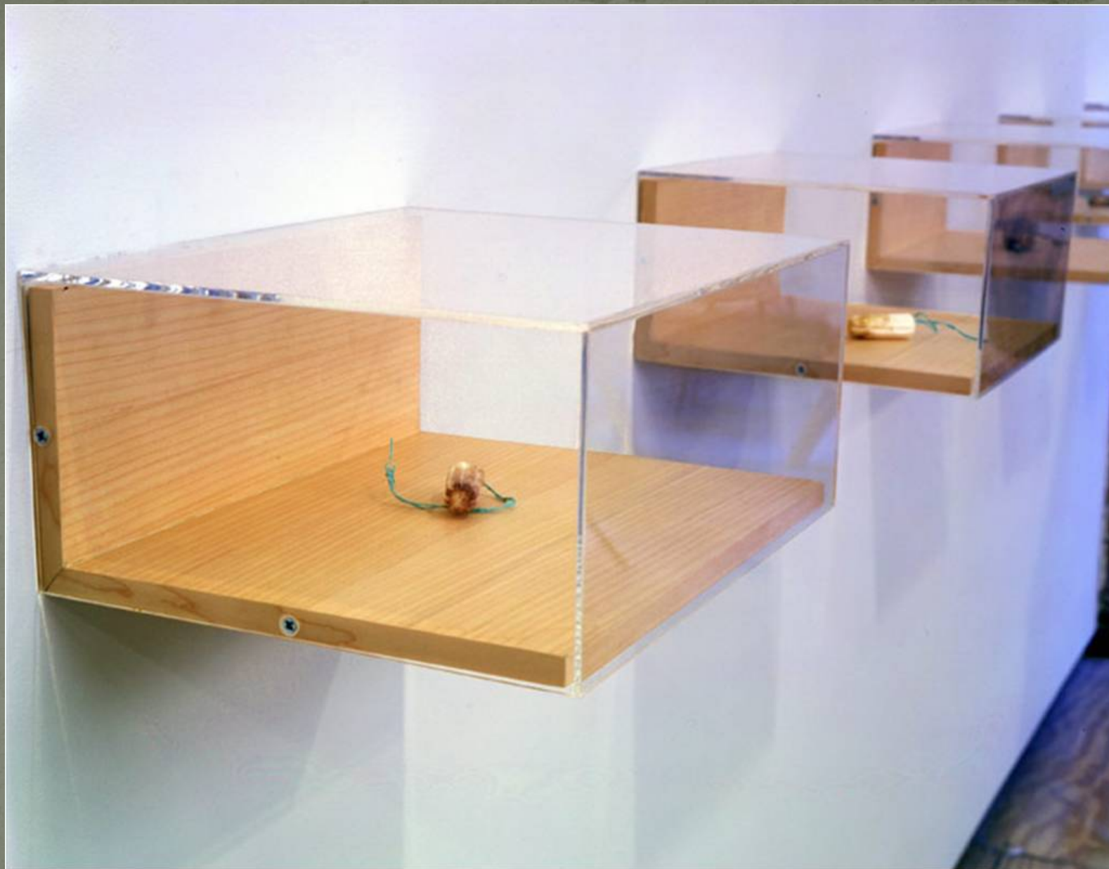
Emin Tracey, The History of Painting , Tampons, Blood, Tissue.