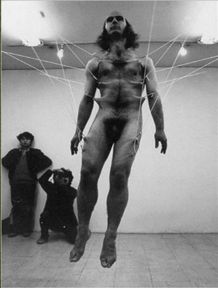
Stelarc, Event for lateral Suspension, 60', 1978