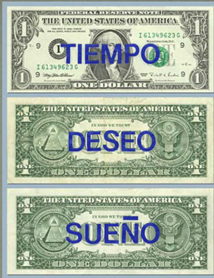
Horacio Zavala, Tiempo, deseo y sueño , 1998, texto sobre papel moneda, 6,6 x 15,5 cm.