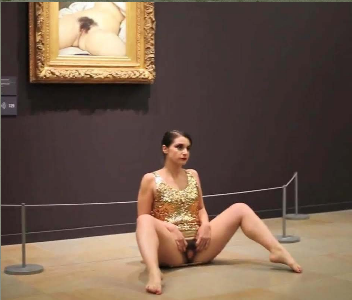
Deborah de Robertis, Mémoire de l'origine , Musée d'Orsay, 29 mai 2014 «Je suis l'origine / Je suis toutes les femmes / Tu ne m'as pas vue / Je veux que tu me reconnaises / Vierge comme l'eau / Créatrice du sperme»