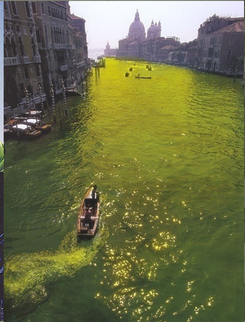
Nicolás García Uriburu, Coloración del Gran Canal, Venecia, 1968.