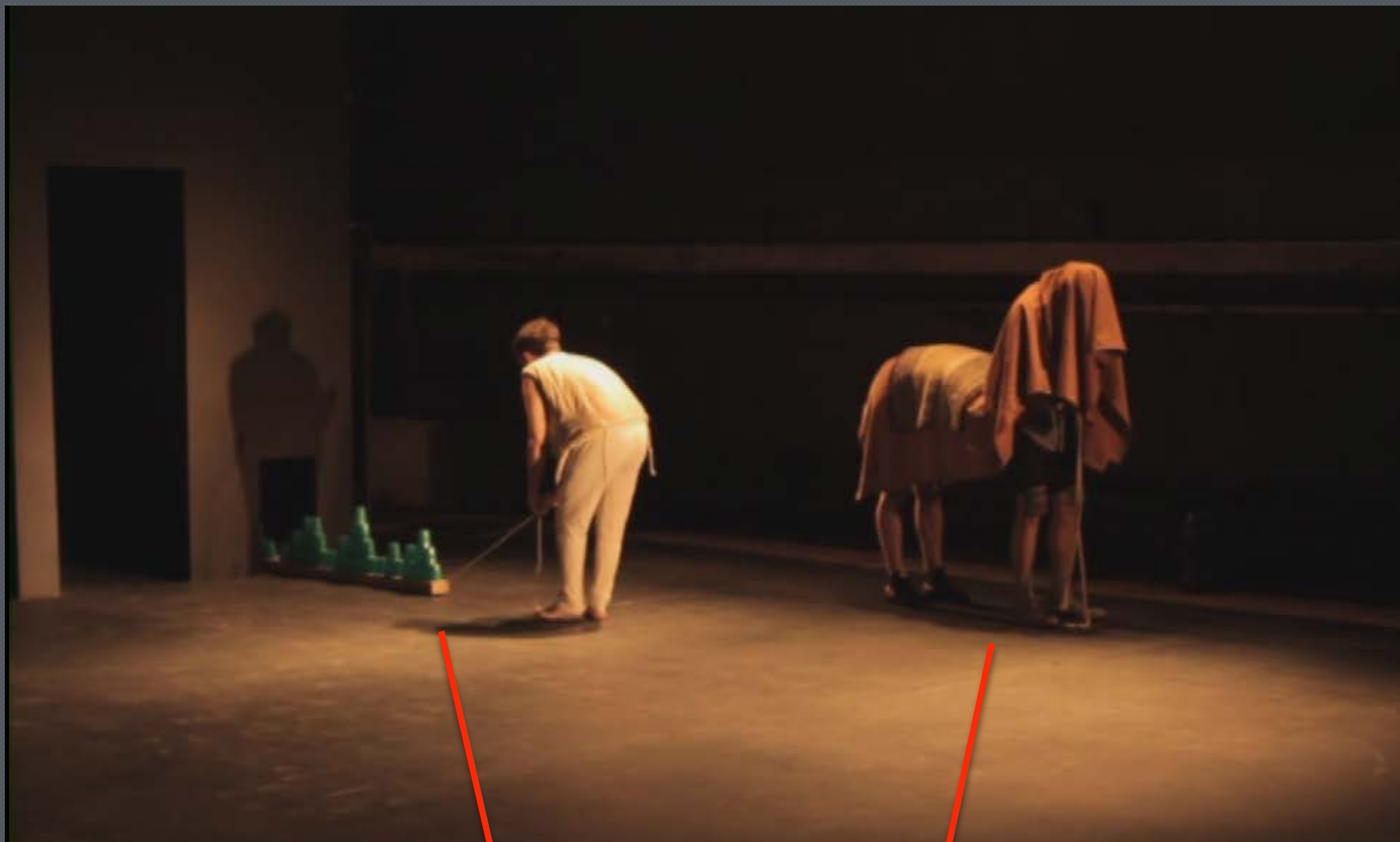
Construcción visible de la escena