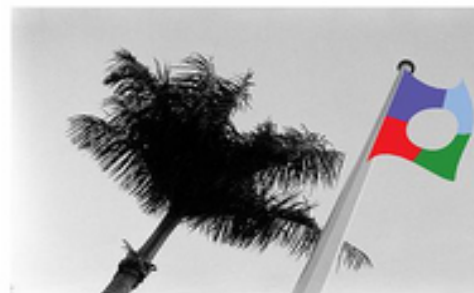
Flag para La Ene Otto Berchem

La Ene desarrolla actualmente dos muestras, Ensayo para una Isla Estrella del artista puertorriqueño Karlo Andrei Ibarra y Flag para La Ene del norteamericano Otto Berchem. Su texto curatorial es una breve reseña que da cuenta de las obras expuestas y la biografía de los artistas. La obra de Berchem está enmarcada dentro de un proyecto homónimo que se gestó a finales de 2013 y que surgió a partir de una muestra realizada el año anterior, Embajada de Zaqistán, en la cual se montó un asta en la pared exterior del museo para la bandera de este imaginario país. El asta quedó en el lugar y es intervenida por distintos artistas seleccionados a través de una convocatoria. Las banderas exhibidas forman parte del patrimonio del museo. La muestra de Ibarra consiste en 4 esculturas y una serie de videos en los que se aborda la situación política de Puerto Rico. Algunas de las obras también fueron realizadas específicamente para la muestra. Las obras establecen una puesta en diálogo con una problemática coyuntural actual en relación al colonialismo y a las fronteras.